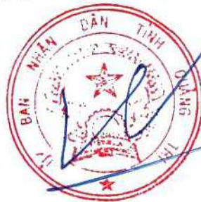
PHÓ CHỦ TỊCH UBND TỈNH Hà Sỹ Đồng

(Ký tên, ghi rõ họ và tên, đóng dấu cơ quan)